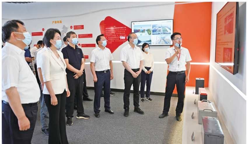
2022年7月7日，市委书记张祥安、市长张君毅率市党政代表团在湖北省鄂州市考察学习。

7月7日，市委书记张祥安、市长张君毅率市党政代表团到湖北省鄂州市考察学习。鄂州市委书记、市人大常委会主任孙兵，市长陈平陪同考察。鄂州市领导徐艳国、程少云、彭波，市领导