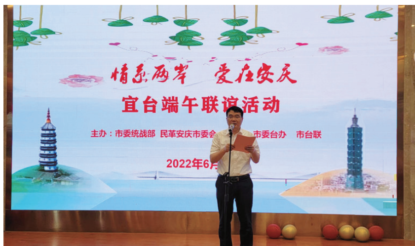
2022年6月1日，“情系两岸、爱在安庆”宜台端午联谊活动举行。

前镇受捐100万元用于建设莲花文化体育广场项目。承办台湾农企皖乡行——两岸乡村振兴发展交流会，促成市政府与全国台企联签署产业发展合作协议。举办“情系两岸、爱在安庆”宜台端午联谊活动，推动促进宜台融合发展。举行市金融机构助力台侨企业发展签约仪式，多渠道破解台侨企业发展资金难题。争取台湾产业园省级发展专项资金68万元。举办台胞黄梅戏文化体验营。继续推动“一带一路”国家安庆联谊会建设，成立印