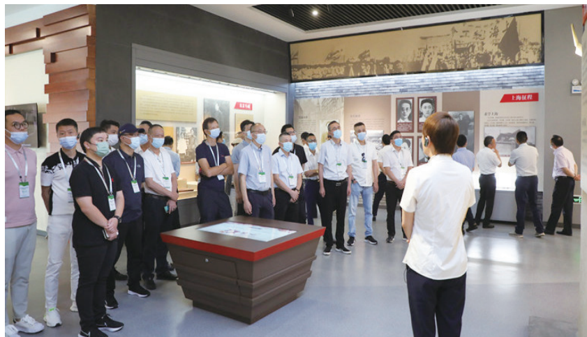
2022年6月10日，澳门福建同乡总会工商考察团在安庆考察交流。