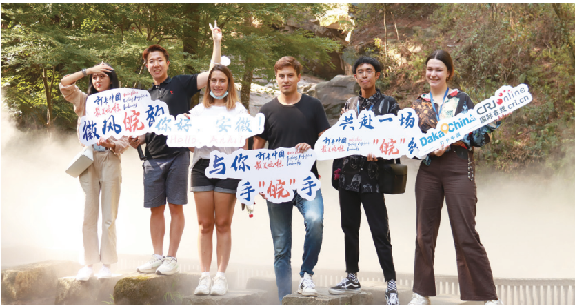
2022年9月6日，“打卡中国·最美地标——你好，安徽！”网络国际传播活动在安庆市拉开序幕。

新华社《瞭望》周刊推出《安庆觉醒》《需要觉醒的不仅仅是安庆》《不止于醒，更重于行》《安庆：奋力打造“五大宣城”》等重磅报道，形成“回安庆、建家乡”“回安庆对了”的良好舆论环境。