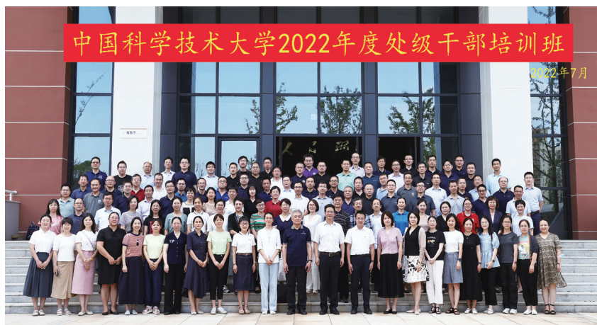
2022年7月，中国科学技术大学2022年度处级干部培训班在安庆市委党校举办。

校专项委托课题1项、省委党校重点课题4项、省社会主义学院课题1项。报送各级各类征文、科研成果20项，获得市厅级以上奖励11项，其中省政府颁奖1项，市厅级一等奖3项、二等奖3项、三等奖4项。首次结项安徽省社科普及及规划项目1项，首次获得省委党校专项委托课题优秀结项成果1项，首次获得省社会科学奖1项，首次获得全省社科普及先进个人1人。全年呈送咨政报告16篇，其中市委书记张祥安批示10篇，市委副书记胡红兵批示8篇，市委常委、市委组织部部长李明月批示1篇。学校教师开发的案例课《为巩固拓展脱贫攻坚与乡村振兴有效衔接提供坚强组织保证——以岳西县为例》被列入全省基层干部主题培训课程（安徽本地4个），案例《防汛战场岂容逃兵》入选省委组织部优秀案例汇编（全省7个），学校拍摄的《燃烧青春化作光——纪念革命烈士陈延年陈乔年》微党课在安徽电视台“二十大精神在江淮”栏目播放，《推动绿色发展促进人与自然和谐共生——深入学习贯彻党的二十大精神》微党课入选省委组织部“党的二十大精神学习课堂”。