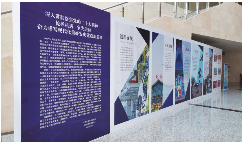
2022年12月，安庆市委宣传部举办“安庆这一年”大型图文展。

习辅导用书17种500余册，编印7期理论学习参考资料。创建“安庆理论武装大讲堂”特色品牌，推出“走出安庆看安庆”系列讲座，邀请《觉醒年代》编剧龙平平等国内知名专家开设3期精品课程。举办全市党委（党组）理论学习中心组学习秘书培训会，开展15场县级以上单位党委（党组）中心组学习列席旁听活动。安庆市委理论学习中心组学习成果入选“奋斗新时代”主题成就展中央综合展区。