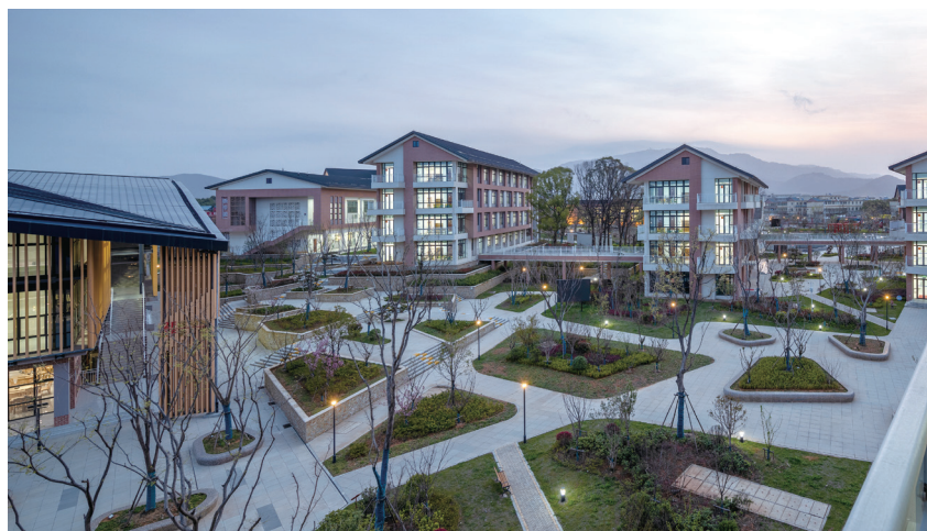
安庆市委党校校园景观

【开放办学】 党校坚持开放办学创品牌，以全市域理念开展干部教育培训，加强区域内各县党校培训资源的优化整合。全市党校集体签订《安庆市党校系统合作办学共同协议》，打破各校单打独斗、制度不一的办学障碍，鼓励本市党校之间联合办学、异地教学，统一收费标准，共建教学基地、共享教学资源，打造全市党校“大外培”的开放办学新格局，围绕“党性锻炼”“文化自信”“乡村振兴”“民族宗教”四个专题，深挖安庆本土培训资源，以特色学科建设打造对外培